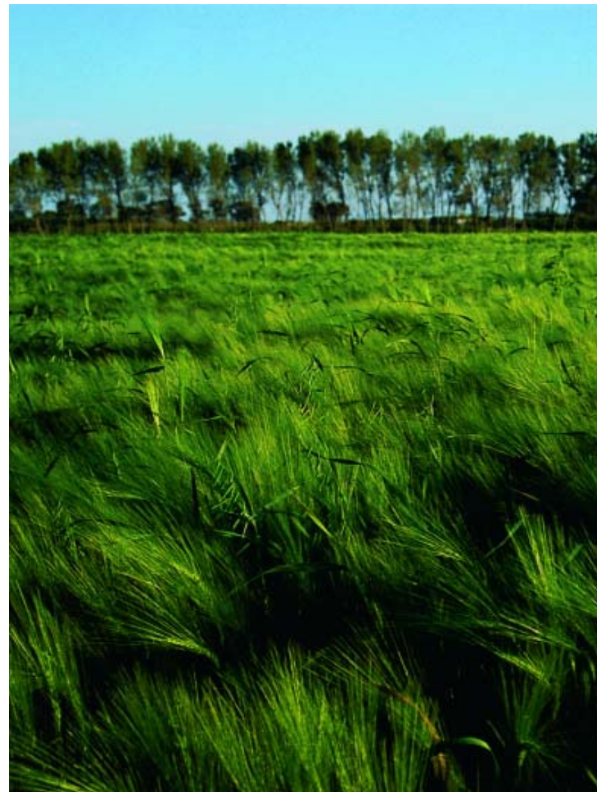
Il litorale domizio