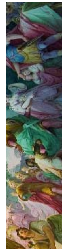
Affresco nella Reggia di Caserta

eventi maggio _Sagra del carciofo Maddaloni _Sagra delle fragole Vairano Patenora maggio-luglio _Leuciana Festival Belvedere Reale di San Leucio giugno _Sagra del prosciutto alla contadina Liberi _Sagra del vino Asprinio Cesa _Sagra della mozzarella e della carne bufalina Pontelatone giugno-settembre _Caserta Summer Festival Caserta luglio _Sagra della pancetta 'alla zingara' Liberi luglio-agosto _Teatri di pietra Concerti e rappresentazioni nei teatri antichi _Luoghi Fuori Luogo Rassegna di teatro e musica Letino, Parco del Matese luglio-settembre _Notti bianche dell'arte Comuni della provincia