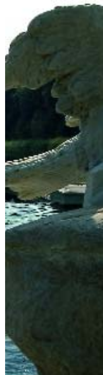
Reggia di Caserta

È proprio questa l'area che gli antichi chiamarono Campania felix , per la posizione privilegiata e la fertilità del suolo. Irrigata dal Volturno e favorita dal clima mite, la provincia si stende dal mare ai rilievi degli Appennini, alternando una rigogliosa vegetazione a luoghi di grande interesse storico e culturale.