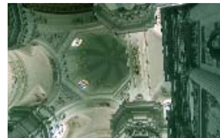
Cattedrale di San Paolo di Aversa