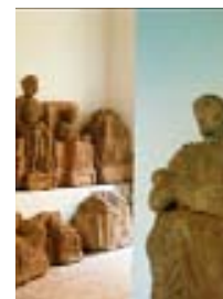
Decorazione absidale della basilica di Sant'Angelo in Formis