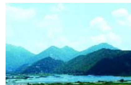
Parco Regionale del Taburno