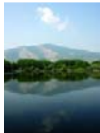
Riserva del lago Falciano